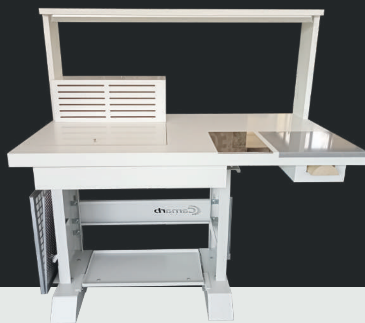
Versione con coperchio in legno