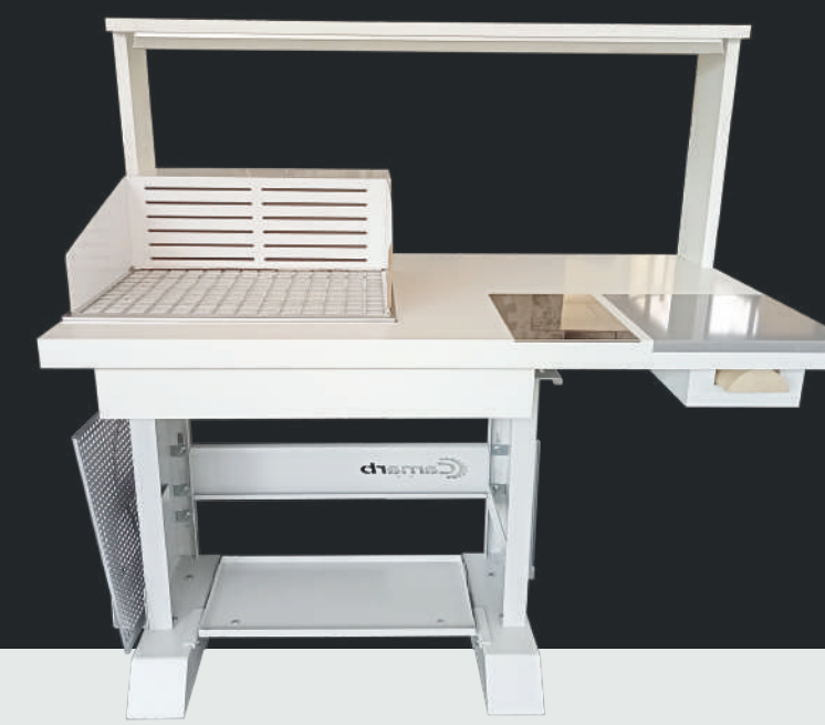
Versione con griglia per collante a base acqua

Il tavolo BR-02-ALL-IN-ONE è un banco da giunteria e finissaggio dotato di sostegno Quick move con ruote a scomparsa per un rapido spostamento nelle catene di produzione. Equipaggiato con un sistema di aspirazione da connettere all'impianto di aspirazione centralizzata, è indicato per l'incollaggio di colle HotMelt / base acqua e base solvente essendo anche accessoriatato di diverse tipologie di griglie, paratie e piani di appoggio per i serbatoi del collante. Come tavolo da lavoro è accessoriatato da una barra led, una piastra inox da 4mm per la punzonatura, un piano in marmo e un ceppo in legno estraibile per la battitura degli stivali. In ultimo il tavolo è corredato di un cassetto con organizer, un supporto laterale per riporre le griglie di incollaggio e un piano in legno da inserire al posto delle griglie per trasformarlo in un tavolo con un piano di lavoro da 120cm x 70cm. Disponibile anche con aspirazione indipendente.