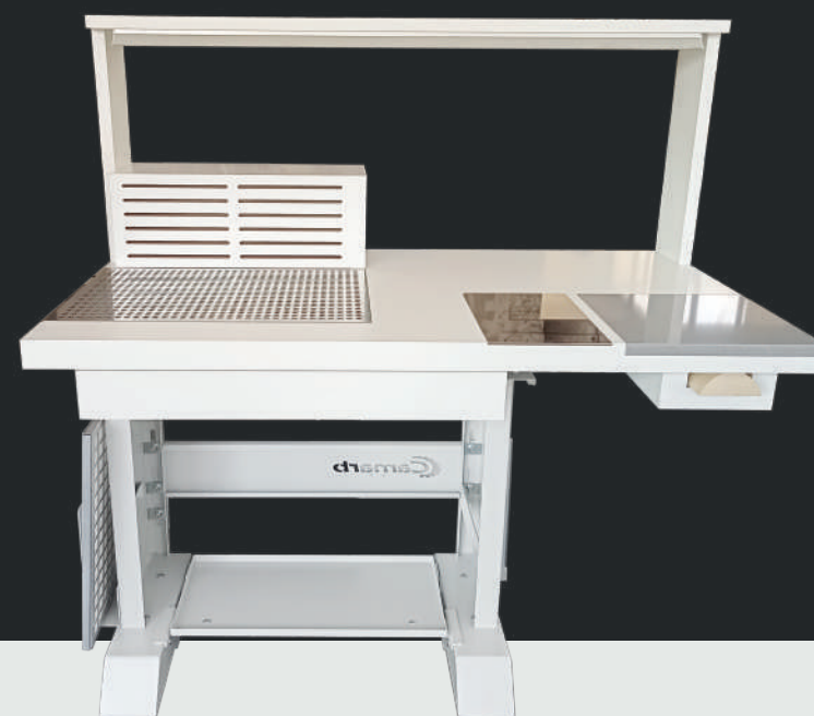
Versione con griglia per collante a base solvente